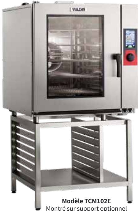
Modèle TCM102E Montré sur support optionnel