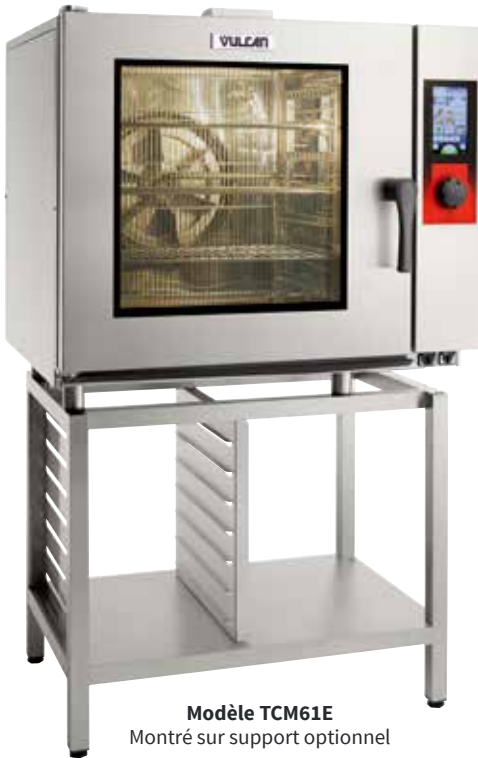
Modèle TCM61E Montré sur support optionnel